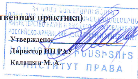
График зимней сессии 2024-2025 учебного года (производственная практика)

МАГИСТРАТУРА 2024-2025 УЧЕБНЫЙ ГОД I СЕМЕСТР, 2 КУРС «ЮРИСПРУДЕНЦИЯ» (магистратура/очная форма обучения)